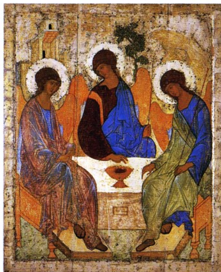
(聖三位一体)1411年頃 アンドレイ・ルブリョフ作 (モスクワ トレチャコフ美術館蔵)

神々しく輝くビザンチンの華〈イコンの道〉ヨーロッパあるいはロシアの美術の源を訪ねる